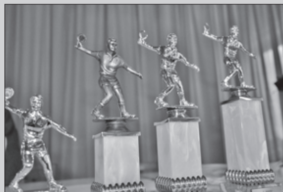
Trofeje pre víťazov