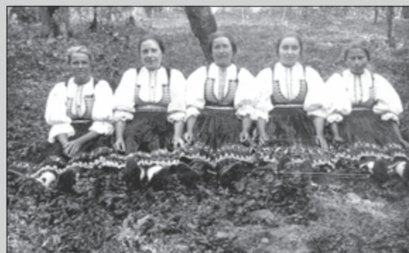
Kálnické dievčatá okolo r. 1925