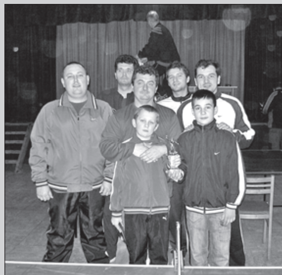
Kálnické mužstvo

V obci Hrádok sa 27. februára 2010 uskutočnil VI. ročník stolnotenisového turnaja mikroregiónu. Zúčastnilo sa 10 družstiev z obcí: Kálnica, Beckov, Kočovce, Nová Ves nad Váhom, Hôrka nad Váhom, Hrádok, Modrová, Modrovka, Lúka nad Váhom, Lehota. Mužstvo Kálnice obsadilo 2. miesto. Zvíťazilo mužstvo Beckova a na 3. mieste boli Kočovce. Organizátori turnaja aj hostia sa zhodli na tom, že kvalita predovšetkým hráčov sa z roka na rok zvyšuje. (b)