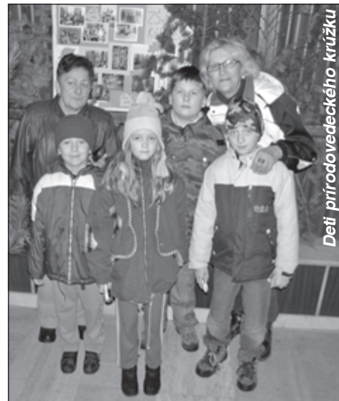
Deti prírodovedeckého krúžku