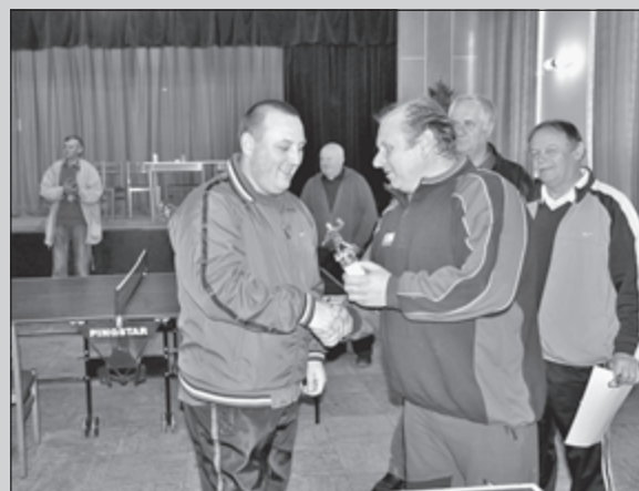
Pri preberaní ceny za 2. miesto