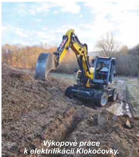
Výkopové práce k elektrifikácii Klokočovky.

obdobie „vysokého šetrenia s vodou“. Druhým vodným zdrojom je zdroj - studňa Klokočovka, ktorá je ale stále nestabilná a od septembra 2017 až po február 2021 bola hladina vody pod úrovňou napúšťacieho potrubia. Vodná hladina