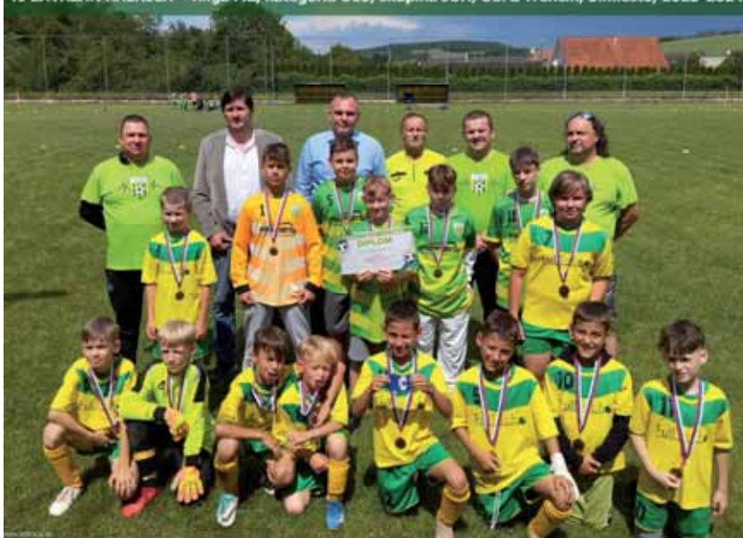
TJ ZAVAZAN KÁLNICA - 4.liga MŽ, kategória U13, skupina JUH, ObfZ Trenčín, 3.miesto, 2023-2024

Kategória U13 si udržala 3. miesto aj napriek tomu, že sme posledný zápas so Starou Turou prehrali, ale skončili sme nakoniec o 1 bod práve pred ňou. Musím ale podotknúť, že v tejto kategórii sme mali málo starších chlapcov a viac ako polovicu mužstva tvorili 10-11 roční chalani, ktorí hrajú aj za U11. A práve do týchto chlapcov sme vkladali veľké nádeje a myslím si, že oprávnené. Súťaž v U11-ke sme jednoznačne vyhrali s obrovským náskokom pred ostatnými mužstvami. Za celú sezónu sme prehrali iba dva zápasy a aj to len veľmi tesne. Skóre 344:35 hovorí za všetko.