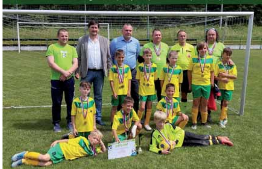
TJ ZAVAZAN KÁLNICA - kategória U11, skupina C, ObfZ Trenčín, 1.miesto, 2023-2024

že máme kvalitný tím a hlavne dávame veľa gólov. Boli mužstvá, ktoré boli radi, že dostali iba 15 gólov, ale boli aj také, ktoré utížili 20 a viac. Nakoniec môžeme skonštatovať, že náš cieľ sa nám podarilo splniť.