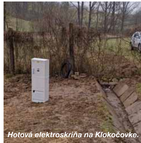
Hotová elektroskriňa na Klokočovke.

Minulý rok sme opravovali výtlky na cestách svojpomocne s vrecovaným asfaltom. Hornú Kálnicu a cestu do Stokov sme repasovali asfaltovou drťou. Úprava cesty týmto spôsobom bola postačujúca pre cestu na Hornej Kálnici, ale cesta do Stokov bola po zime znova v havarijnom stave. Rozhodli sme sa, že oslovíme lesné spoločnosti a spoločne opravíme cestu do Stokov. Táto aktivita sa podarila a následne chceme pokračovať opravou cesty aj do Krajnej doliny. Oslovil som lesné spoločnosti, chatárov a v auguste - septembri by sme chceli opraviť hlavne najviac rozbitú cestu za dreveným mostom, pod bývalou Kálnickou chatou.