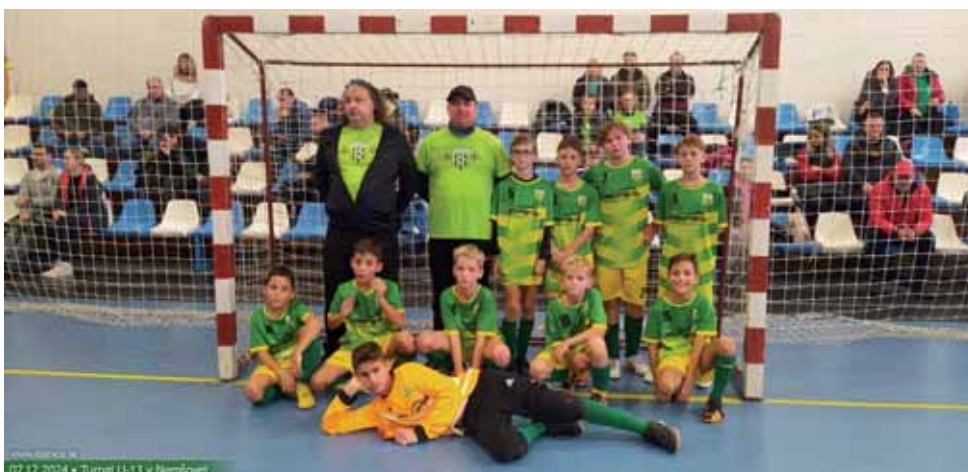
07.12.2024 • Turnaj U-11 v Nemšovej