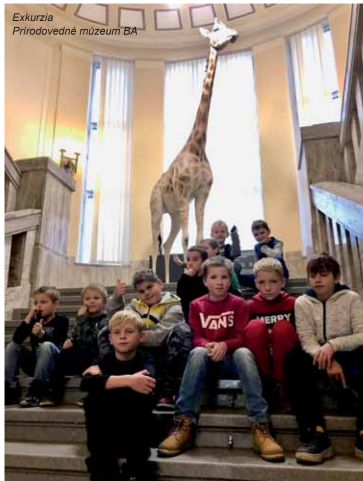
Exkurzia Prírodovedné múzeum BA