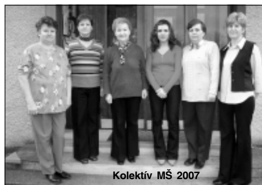
Kolektív MŠ 2007

nové natreté oplatenie a zariadenie školského dvora a záhrady v pestrých farbách. V triedach deťom pribudol nový nábytok, nové stoly a stoličky, nový koberec i záclony, zakryla sa podlaha. Kolektív učiteliek venuje mimoriadnu pozornosť i interiéru materskej školy, ktorý svojou estetickou výzdobou podľa ročných období vytvára priaznivú atmosféru pre pobyt detí v MŠ. Materská škola by mala byť pre každé dieťa príležitosťou zmyslupl-