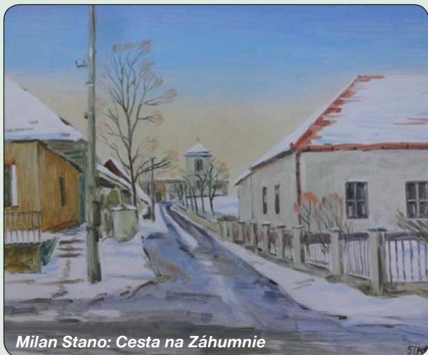
Milan Stano: Cesta na Záhumnie