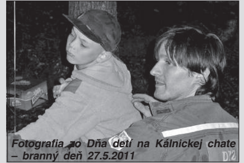
Fotografia zo Dňa detí na Kálnickej chate - branný deň 27.5.2011