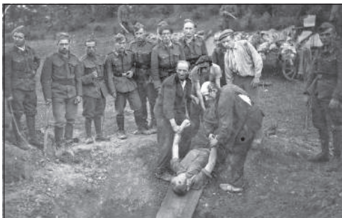
Foto z koncentráku v Nemecku – väzni hádzali mŕtvych do spoločného hrobu : „Otec to nechcel robiť, strašne ho zbili.“