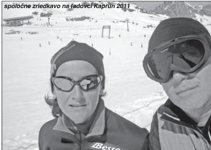
spoločne zriedkavo na ľadovci Kaprun 2011

Prevádzkovať ski areál iba 2-3 mesiace v roku je veľmi málo. Čo to ostatné mimo zimné obdobie? Kálnica zatiaľ nie je lokalita, kde by samostatne chodili stovky ľudí na turistiku alebo do prírody a dalo sa narábať s percentami návštevníkov pri budovaní rôznych turistických atrakcií. Musíme postupovať naopak. Najprv sa treba zamerať na konkrétnu cieľovú skupinu a tá postupne začne na seba nabaľovať ostatných ľudí, ktorí aj nie celene navštívia túto lokalitu. Zo štatistik je bicyklovanie po pešej turistike a behu na trefom mieste. A keďže chceme využiť vývoz vlekom, nebolo nad čím rozmýšľať. Na ilustráciu v kanadskom lyžiarskom stredisku Whistler, kde bola posledná zimná olympiáda, je pomer lyžiara ku bikerovi 40:60, ale aj iné strediská, už spomínaný Semmering je najnavštevovanejšie bike centrum v Rakúsku. Netreba vymýšľať na začiatku niečo úplne nové, iba zopakovať to, čo niekde inde už funguje roky a potom to prispôbiť na dané podmienky a možnosti. Musím pokračovať a dávať do toho všetky svoje skúsenosti. S bike centrom som tak ďaleko, že organizujem medzinárodný seriál pretekov v zjazde na horských bicykloch, Moravsko-slovenský DH Cup, ktorý konkuruje národným pohárom v Česku a na Slovensku. Radi by spolupracovali ľudia z Košíc, Donovalov, Bratislavy a iných lokalít, ponúkajú sa na spoluprácu Moraváci a Poliaci. Momentálne sme stredisko s najdlhšou prevádzkou bike centra v našej spádovej oblasti, ktorá je dvakrát väčšia ako pri ski centre.