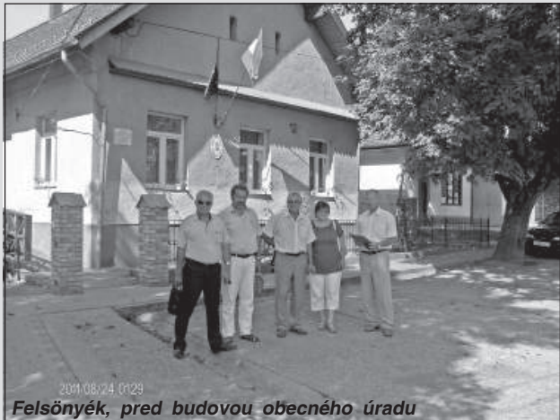
2011.08.24. 09:29 Felsőnyék, pred budovou obecného úradu