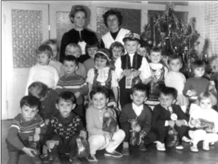
1968 – prvé Vianoce v škôlke v Kálnici