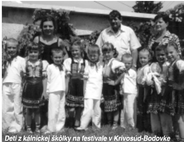
Deti z kálnickej škôlky na festivale v Krivosúd-Bodovke

súboru „BESEDA“, využili sme možnosť pozvať na vystúpenie účastníkov folklórneho festivalu „Akademická Nitra“ i k nám do Kultúrneho domu v Kálnici. Usporiadatelia festivalu našu ponuku prijali, a tak sme mali možnosť vidieť vystúpenie Slovenského umeleckého súboru Krajan - Vojvodina a skupinu gajdošov BEGPIPE CONSORT z Belgicka. Kto na vystúpení nebol, neuverí.