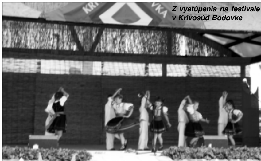
Z vystúpenia na festivale v Krivosúd Bodovke

Čo je ale podstatné, Kálničania prekvapili i samotných účinkujúcich nielen účasťou, spontánnou kultúrnou atmosférou, ale i oceňovaním ich výkonu častým potleskom, čo bolo najkrajším vyjadrením uznania prítomných divákov. (st)