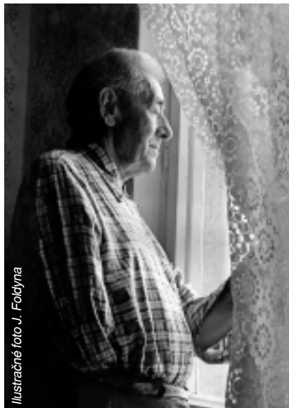
Ilustračné foto J. Foldyna

tiku umiestenia v DSS alebo DD neriešia, potom je štatistika úplne iná. Z 31 vyplnených anketných lístkov bolo 23 od občanov do 80 rokov, 5 od občanov do 90 rokov a jeden od občana nad 90 rokov. Chcem sa preto hneď na tomto mieste poďakovať všetkým, ktorí si našli chvíľu času, anketné lístky prečítali, vyplnili a odovzdali. Vysoko si vážim tento váš postoj !