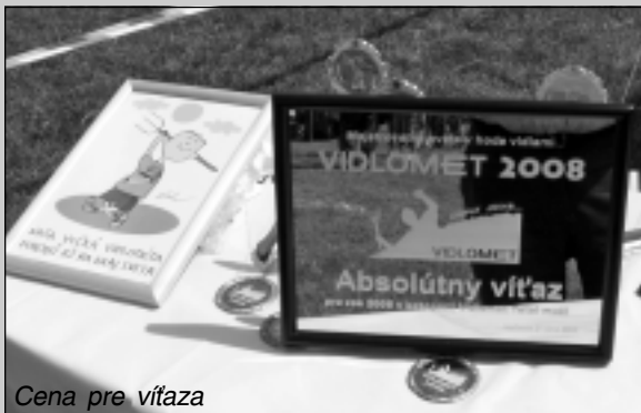
Cena pre víťaza