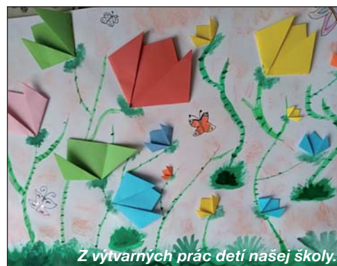
Z výtvarných prác detí našej školy.